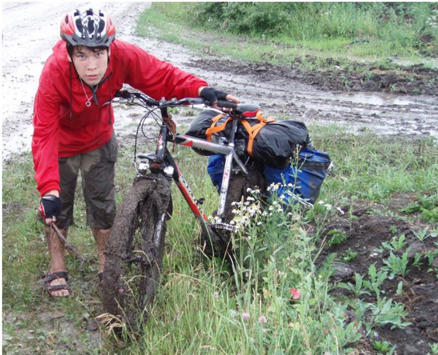
Дорога после дождя. Томская область село Лучаново.